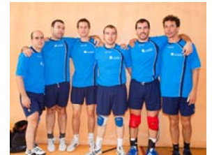
Nuestro equipo de voley